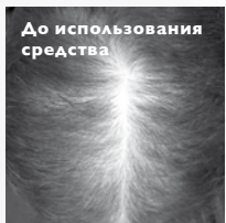
ДО: Кожа головы сухая. Волосы слабые и истонченные.

Клинические исследования* показали, что Восстанавливающий тоник для кожи головы обеспечивает эффективный уход, способствуя заметному улучшению состояния кожи головы и волос.