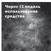
ПОСЛЕ: Кожа головы здоровая и ухоженная. Волосы становятся гуще и пышнее.

* Клинические исследования, проведенные компанией Amway.